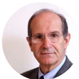
Pr Alim Louis BENABID Neurochirurgie Grenoble