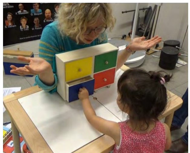
Enfant avec paralysie cérébrale avec son ergothérapeute en stage de rééducation intensive