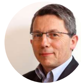
Pr Louis VALLEE Neuropédiatrie Lille