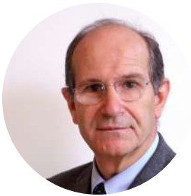
Pr Alim Louis BENABID Neurochirurgie Grenoble